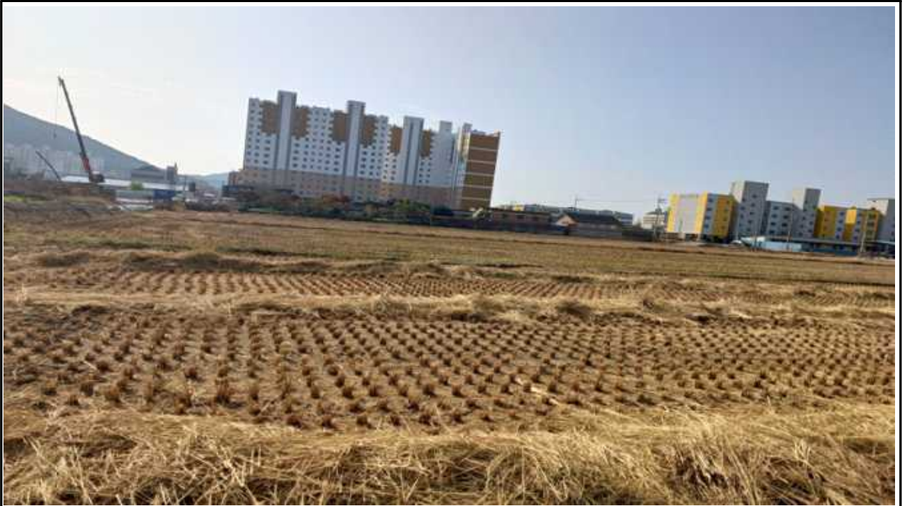
사업부지 현장 사진